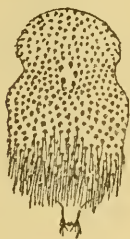
Fig. 1. Abdomen von Cyclopodia hopei Westwood ♀. Malediven.

Von besonderem Interesse ist das eine Weibchen, da die Frage wiederholt aufgeworfen wurde, ob Cyclopodia hopei (Westw.) [♂] und sykesi (Westw.) [♀] Männchen und Weibchen einer Art sind oder nicht. Westwood selbst hält es für möglich, wie aus der Originalbeschreibung ersichtlich ist. Vorliegendes Weibchen stimmt mit der Abbildung Westwood's in der Behaarung des Hinterrandes des vorletzten Abdominalsegmentes ziemlich überein, es sind eine ganze Anzahl von Reihen borstenförmiger Haare. Wie beistehende Abbildung (Fig. 1) des Abdomens zeigt, ist das ganze übrige dorsale Feld gleichmässig bedeckt mit schwarzen Punkten, die Rudimente von Haaren darstellen; in der Mitte des Rückens bleibt ein rundliches Feld frei von diesen Rudimenten und wird umgrenzt von 5 grossen schwarzen Dornenrudimenten (bei C. sykesi nur 4), die als schwarze Hügel erkennbar sind. Die in der Westwood'schen Figur bei C. sykesi angegebenen seitlichen grösseren Dornenrudimente fehlen vorliegendem Thier. Abdominalspitze seitlich mit einigen Haaren.